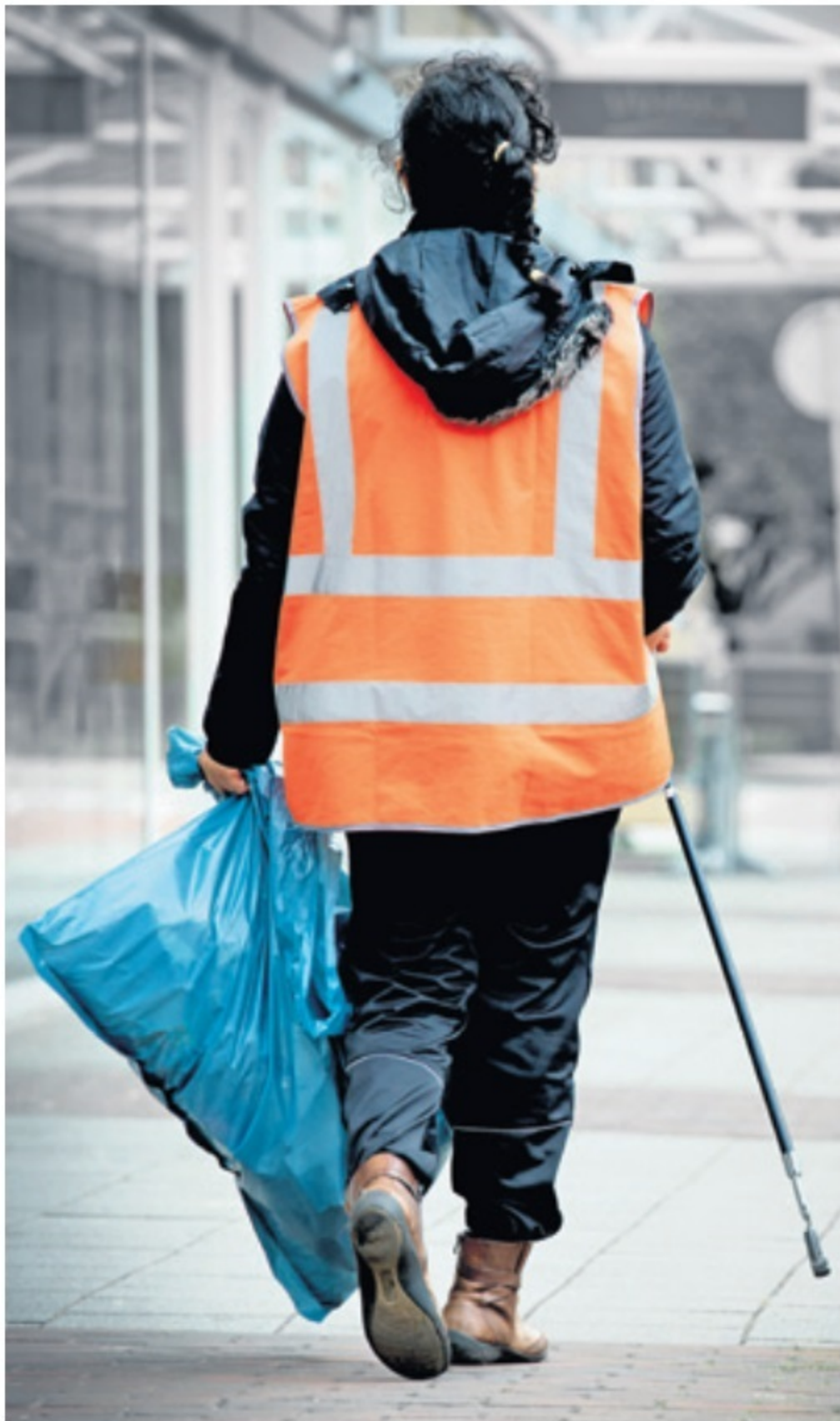
Tegenover een bijstandsuitkering staan nu controles en tegenprestaties, zoals vrijwilligerswerk of mantelzorg.

'Wat doet het met mensen als ze in plaats van een vingertje te krijgen, zelf een eigen plan mogen maken?'